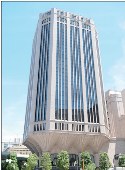
大同生命大阪本社ビル(大阪市西区江戸堀) ～加島屋が店を構えた地に建つ～