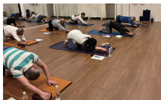
半田第2支部 健康セミナーの様子