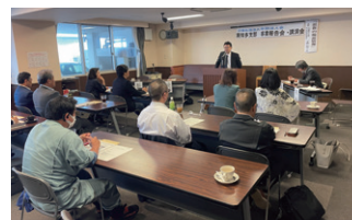
南知多支部 講演会の様子