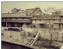
大同生命の礎を築いた 大坂の豪商「加島屋」