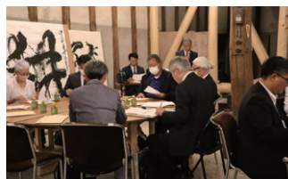
半田第4支部 講演会の様子