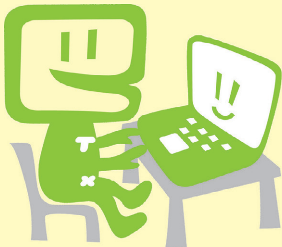
国税庁 e-Tax キャラクター イータ君