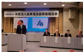
東海支部 事業報告会の様子