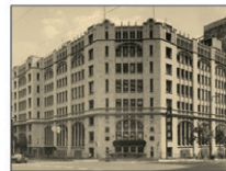
旧肥後橋本社ビル (設計:W・M・ヴォーリス)