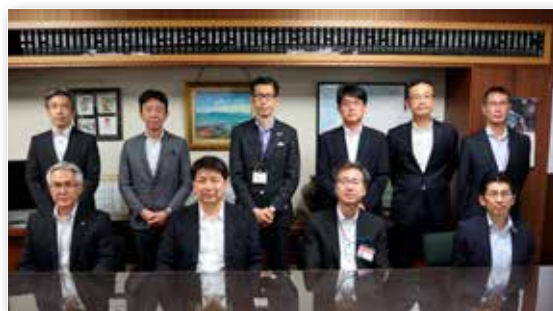
—8/3 新署長表敬訪問・役員会—