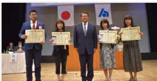
—— 前理事並びに前委員の皆様 ——