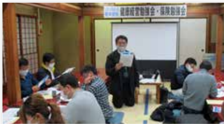
—12/10 健康経営勉強会・保険勉強会— 講師：大同生命保険(株) 浅野半田営業所長