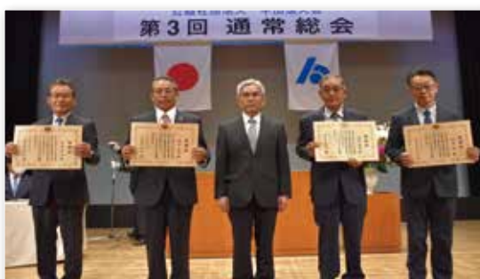
—— 受賞者の皆様 ——