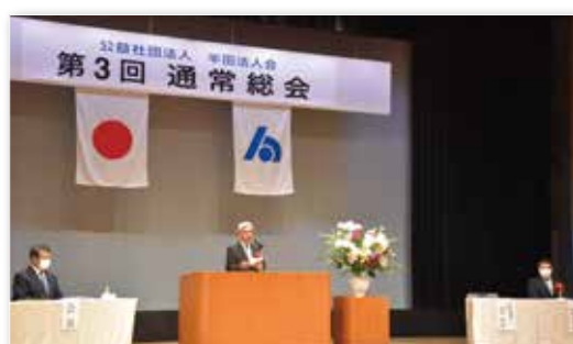
祝辞を述べられる村松半田税務署長