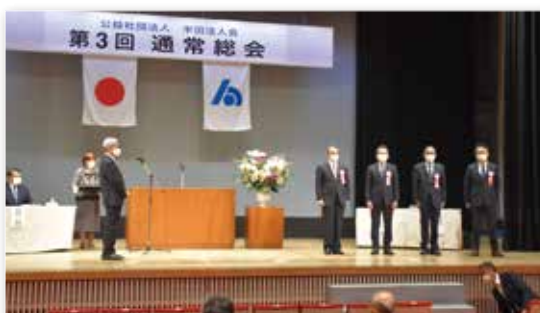
—— 表彰式の様子 ——