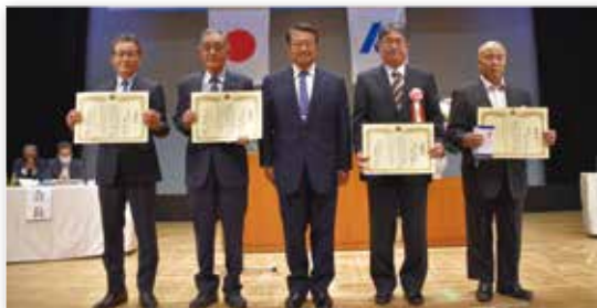
—— 前常任理事の皆様 ——