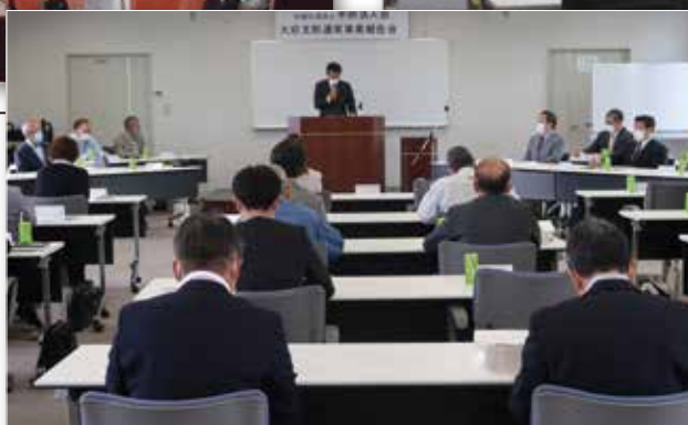
大府支部事業報告会