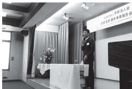
大府支部／事業報告会