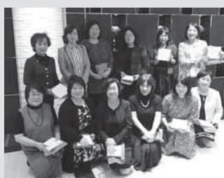
女性部会退任役員