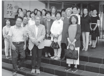
半田第4支部視察研修会 6月27日(金沢)