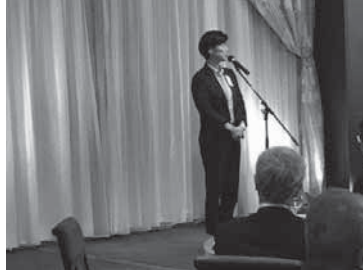
今枝半田税務署長 挨拶