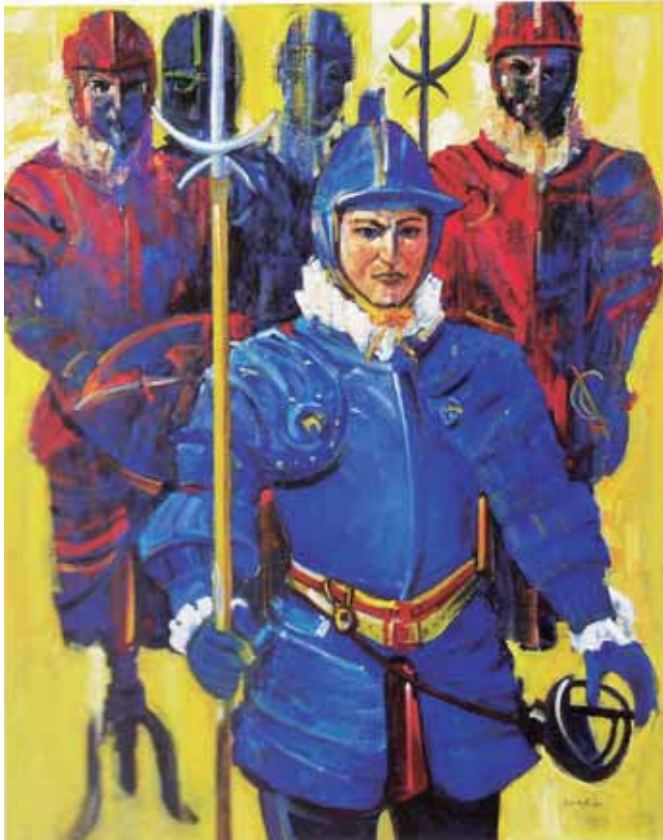
「マルタの騎士」 改組 新 第5回日展 (2018年)