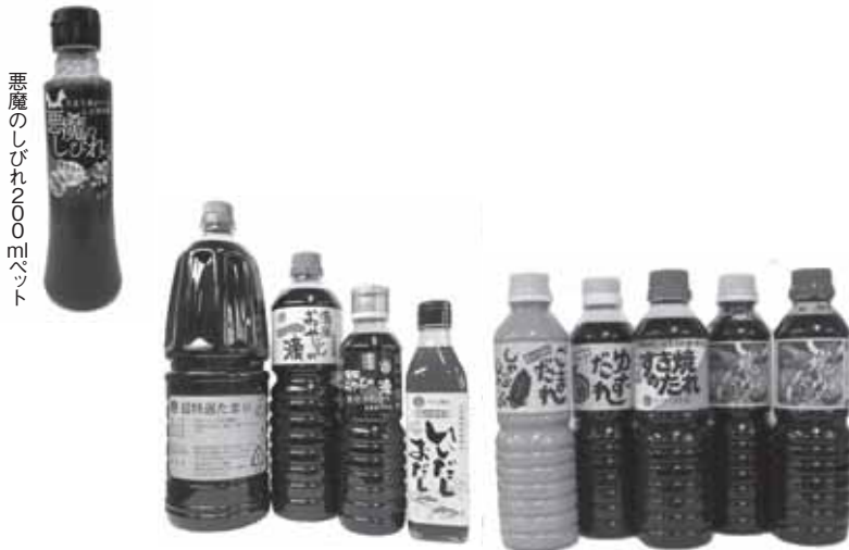
悪魔のくちねNOOエキス

たまりでは非常に珍しい電気透析装置を使った脱塩や脱色装置を早い段階で導入して、幅広い要望に答えながら、国産原料のたまりや、グルテンフリーのたまりの醸造にも着手して、様々なニーズに応えられるように日々研鑽しております。