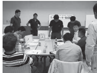
特別事業塾「ファンリテーター養成講座」 7月2日(半田市市民交流センター)