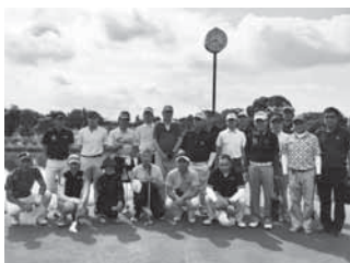
半田第2支部 6月28日(半田ゴルフリンクス)