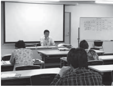
消費税軽減税率制度説明会 5月31日(半田税務署)