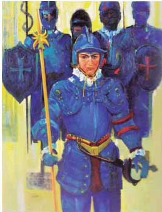
「マルタの騎士」 第104回光風会展 (2018年)