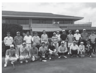
半田第3支部 6月5日(半田ゴルフリンクス)