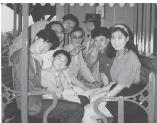
●最初の半田税務署勤務時代の仲間とディズニーランドにて④(平成4年)

半田税務署には、昭和63年7月（当時29歳）から4年間勤務しましたので、今回が二度目の勤務になります。当時はまだ、週休二日制度になっておらず、土曜日は半ドン（半日勤務）でしたので、職員は土曜日の午前中の仕事が終わると、昼から知多半島のあらゆる方面に繰り出し、ビーチバレーやバーベキュー、釣りなどを楽しんでいました。私はその頃、子育てしながらの勤務でしたので、半ドンで仕事が終わるとそのような職員を横目で見ながら、子供を迎えに保育園に直