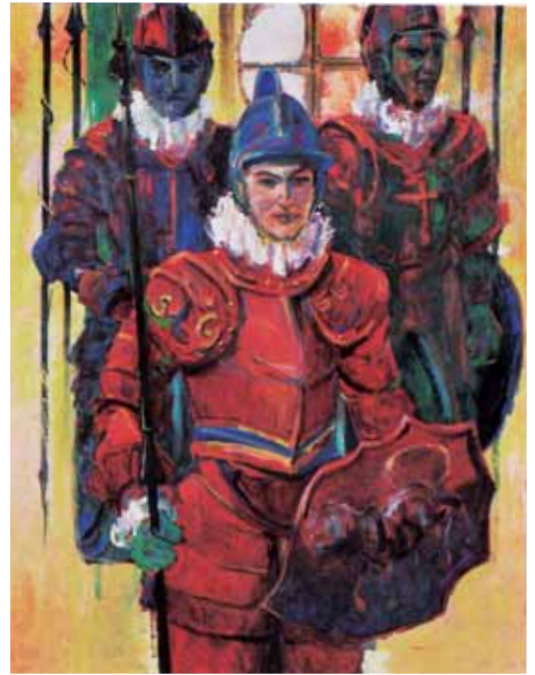
「マルタの騎士」 第105回記念光風会展 (2019年)